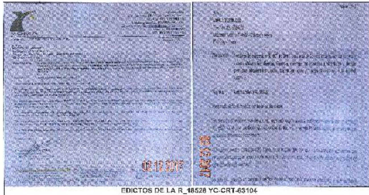
EDICTOS DE LA R_18528 YC-CRT-63104